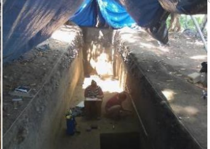
Excavaciones arqueológicas en la plataforma o montículo principal del sitio Guadalupe