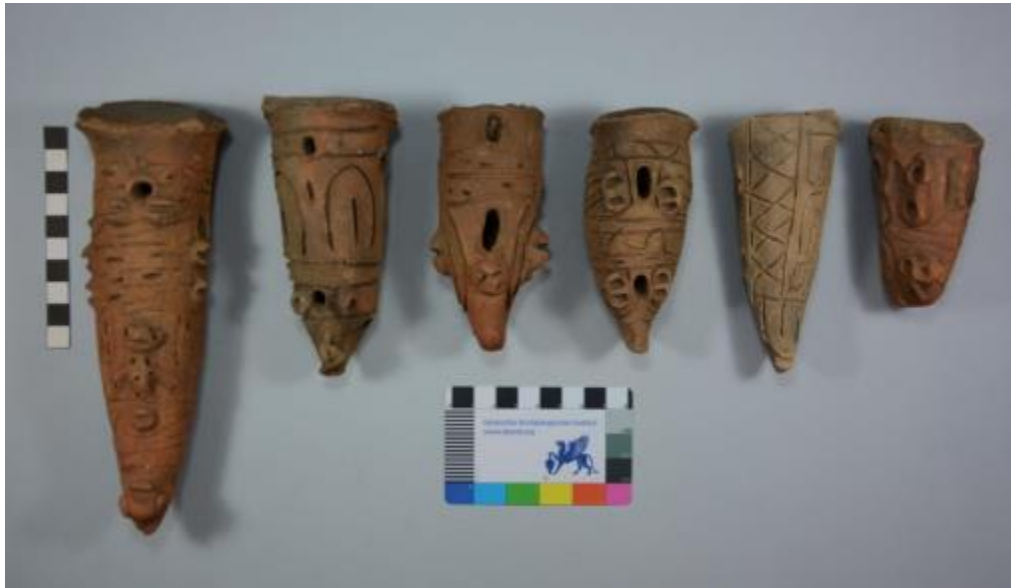
Fragmentos de soportes obtenidos en el Proyecto Guadalupe