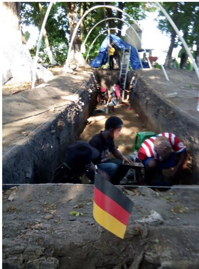
Labores de excavación arqueológica en la plataforma principal del sitio de Guadalupe

Con respecto a la cerámica se puede constatar que el inventario de hallazgos en primer lugar consiste en fragmentos no pintados, decorados por incisiones y aplicaciones. Una gran cantidad del material cerámico recuperado consiste en asas y soportes. La iconografía muestra mayormente formas zoomorfas o antropomorfas. En algunas de ellas se reconocen elementos de la fauna local. Motivo recurrente es por ejemplo el manatí. Excavaciones en lugares de la región han mostrado que este animal jugó un papel importante en la subsistencia. Aunque algunos motivos se pueden identificar claramente, otros quedan enigmáticos. Respecto a su datación, análisis estilísticos y análisis de pruebas de C14 mostraron que las capas superiores datan del periodo Cocal (1000-1525 d. C.), sobre todo en su fase tardía (1400-1525 n. C.)