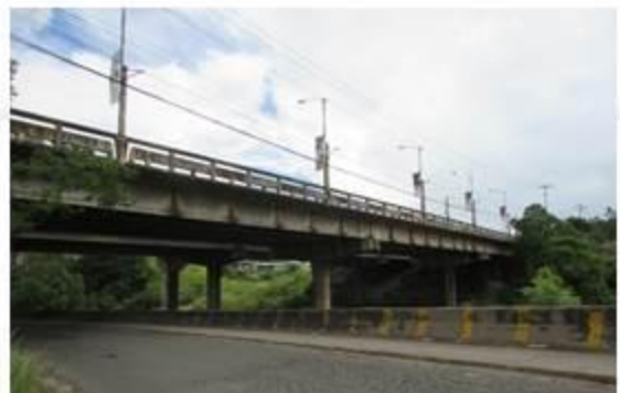
Puente Las Brisas