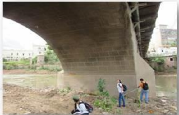
Labor de levantamiento realizada por voluntarios de la UNAH bajo el puente Mallol