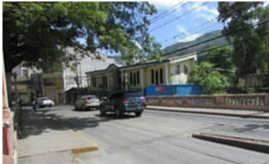
Puente San Rafael