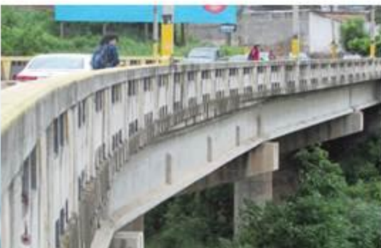
Puente Hernán Corrales Padilla o La Bolsa