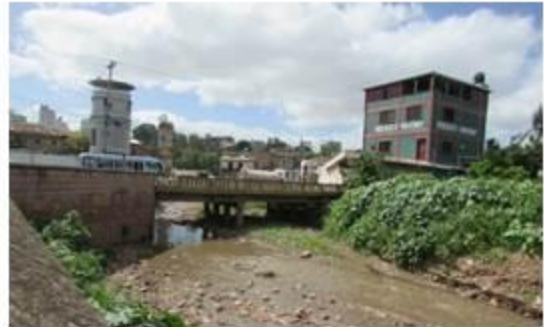
Puente La Hoya