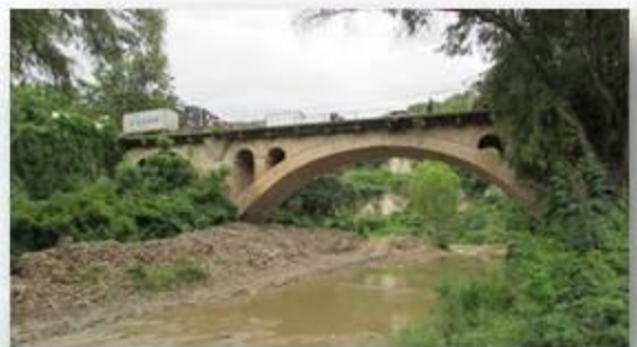
Labor de levantamiento levantamiento fotográfico en el Puente Germania