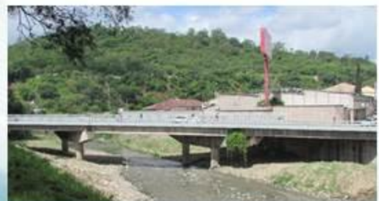
Puente Juan Manuel Gálvez o Guacerique 2