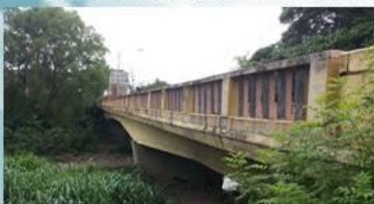
Puente José Cecilio del Valle